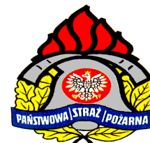
TABELA SYGNAŁÓW ALARMOWYCH